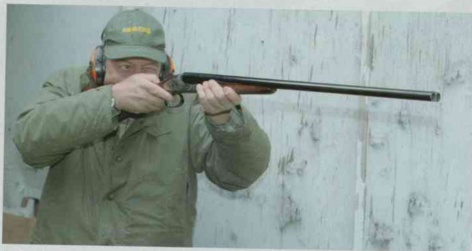
L'autore impegnato nella prova a fuoco.

cussione energica costante sia nella posizione sia nella profondità. Dopo questo breve test, concluso dai consueti colpi in placca, ci spostiamo per raggiungere il Percorso di caccia, in cui provare l'arma su bersagli dalle traiettorie diverse e più divertenti. Sparare con la doppietta al piattello crea sempre un attimo di imbarazzo in chi non è più che abituato e per questo iniziamo sparando già imbracciati per non subire l'effetto sorpresa. Dopo qualche inevitabile ritardo ed errore di anticipo, iniziamo a prendere confidenza anche in pedana con la doppietta Siace El e possiamo riaffermare l'impressione iniziale: il fucile è versatile, nel senso che si piega con grande docilità ai desideri del tiratore.