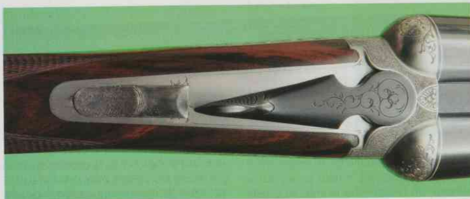
Vista dall'alto della leva di apertura e del cursore della sicura.

(presente sul modello nelle nostre mani) è ottenibile esclusivamente su richiesta. La sicura è manuale a cursore, posizionata sul dorso dell'impugnatura. Oltre al calibro 20 della nostra prova, la doppietta Siace El viene fabbricata in 12, 28 e .410, ciascuno dotato di bascula "dedicata" a eccezione del modello .410, che adotta la bascula del calibro 28.