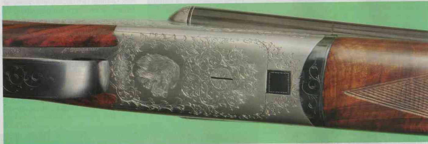
Il lato inferiore della bascula. Si apprezzano l'incisione con testa di setter al centro del petto e la lavorazione arrotondata che caratterizza questo elegante modello da caccia.

Avevamo soppesato con soddisfazione il fucile sentendolo ben bilanciato e rilevandone il positivamente il peso contenuto (alla bilancia 2.660 grammi). Ora, con le