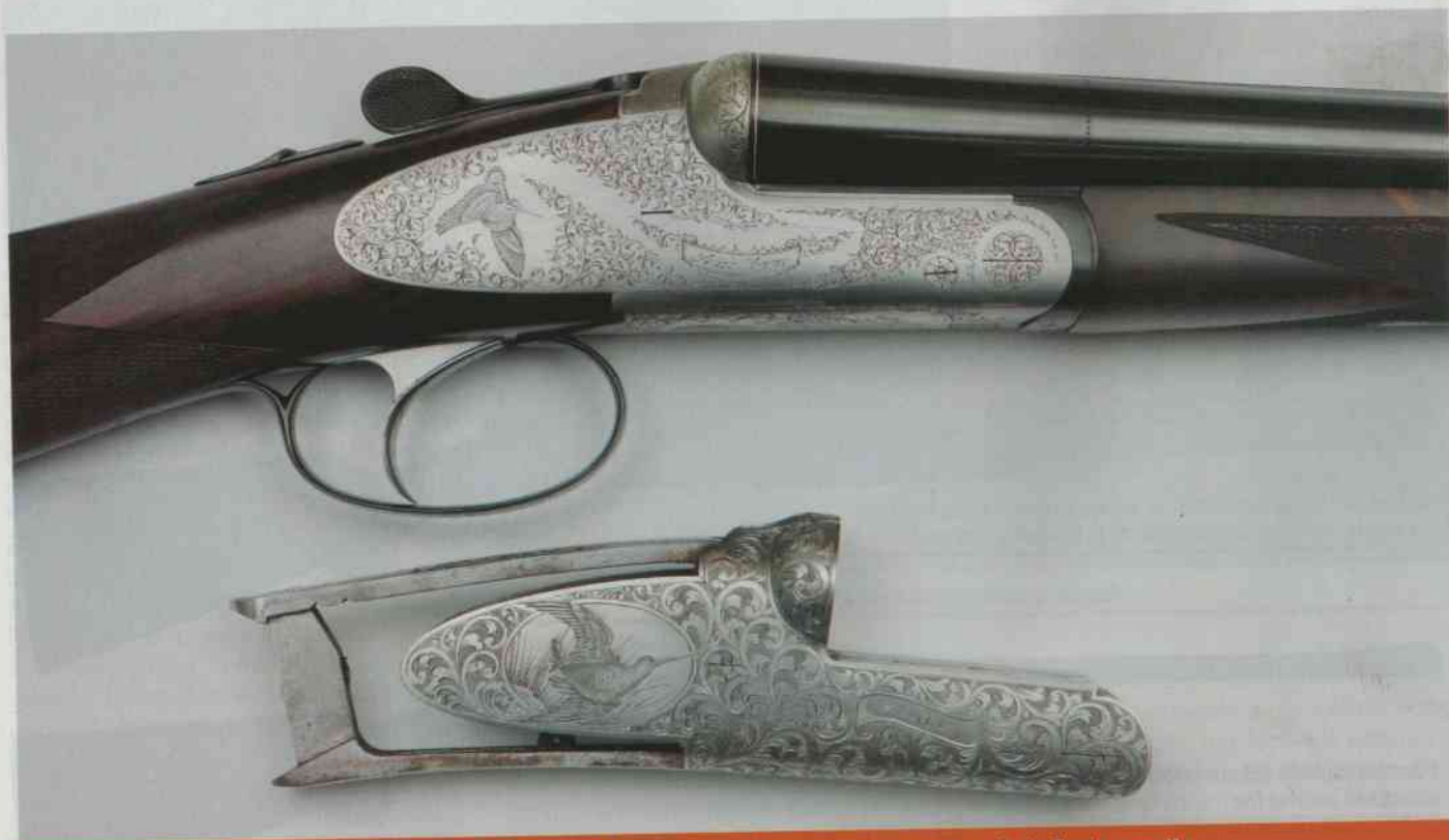
Lato destro della bascula della doppietta calibro 20 e, sotto, della calibro 28. Tutti i calibri hanno bascula dedicata, eccetto il .410 che sfrutta la bascula 28.

Dopo l'espansione e il rinnovamento tecnologico degli anni Ottanta, che portò molte botteghe artigiane del bresciano ad assumere nuova struttura e tecnologie avanzate con la produzione in piccole serie, prevalentemente improntate alla produzione di sovrapposti, i laboratori artigiani del mondo armiero si sono note-