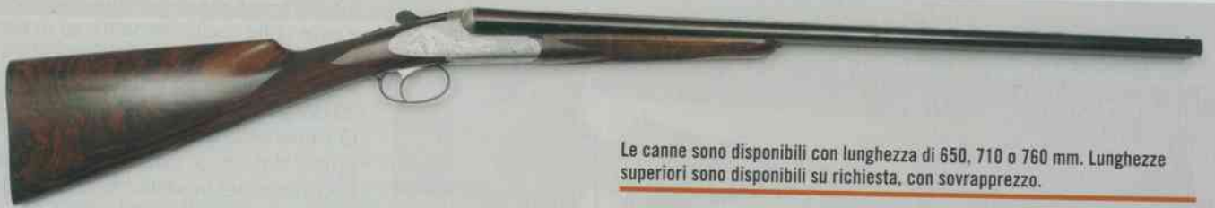
Le canne sono disponibili con lunghezza di 650, 710 o 760 mm. Lunghezze superiori sono disponibili su richiesta, con sovrapprezzo.

sionati da sempre alle classiche doppiette d'impronta classica, avevano un "loro" giustapposto nel cuore, e pur avendo già in produzione diversi paralleli di lusso, anche a cani esterni, hanno messo a punto un progetto raffinato e gradevole che rappresenta una sintesi del loro gusto, la leggera e piacevole doppietta 475 P Superlight El oggetto della nostra prova. Al primo sguardo la linea della Siace 475 P Superlight El è nel segno della tradizione: calcio all'inglese, asta sottile, bascula ribassata con cartelle lunghe, piega non eccessivamente accentuata. Quello che salta agli occhi, invece, bilanciando il fucile tra le mani, è che la doppietta dei fratelli Gelmini è un fucile da caccia nel pieno senso della parola: non si tratta soltanto di una elegante alternativa al sovrapposto da riservare alle occasioni di prestigio, ma di un'arma a tutta caccia, leggera e maneggevole, pensata per un uso intenso, quindi robusta ed efficace. Il movimento fluido, quasi elastico con cui la doppietta sale alla spalla, l'allineamento immediato, l'impugnabilità quasi naturale sono tutte qualità che il cacciatore percepisce immediatamente. Poi, aprendo il fucile, si apprezzano le doti sostanziali, la solidità meccanica e la robustezza: la chiusura è precisa, quasi ruvida, lo scatto degli estrattori netto e forte, gli accoppiamenti ineccepibili.